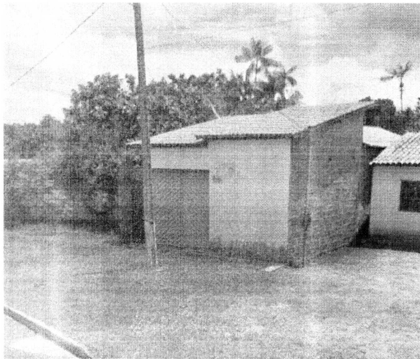
Fachada do imóvel.