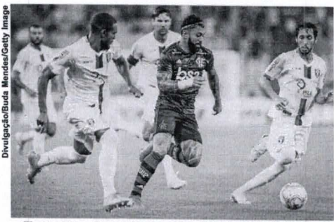
Flamengo e Resende se enfrentam hoje no Maracanã

Flamengo x Resende medem forças na noite desta sexta-feira (19), às 21h (horário de Brasília), no Maracanã, no Rio de Janeiro, em jogo válido pela quarta rodada da Taça Guanabara, que corresponde a Primeira Fase do Campeonato Carioca.