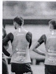
Mancini afirmou que o clube está atento ao mercado e falou em "cereja do bolo"

O Corinthians ainda não contratou jogadores para a temporada, mas o torcedor pode esperar reforços "pontuais". O técnico Wagner Mancini afirmou que o clube está "atento ao mercado" e falou em "cereja do bolo".