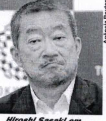
Hiroshi Sasaki em entrevista coletiva em Tóquio

O chefe de criação da Olimpíada de Tóquio, Hiroshi Sa-