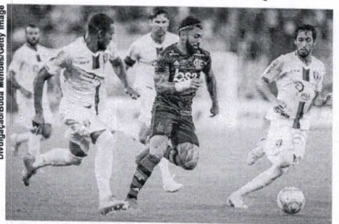
Flamengo e Resende se enfrentam hoje no Maracanã

Pichados - Muros da sede do Flamengo na Gávea amanheceram pichados nesta quinta-feira, cujas reivindicações foram a contratação de Rafinha, em negociações travadas nas últimas semanas, e a saída do vice-presidente de relações