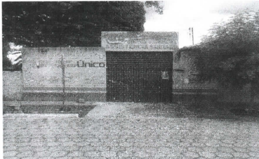
Fachada do imóvel

PROPIETÁRIO: Mitra Diocesiana de Imperatriz. CNPJ: 12.084.745/0001-27