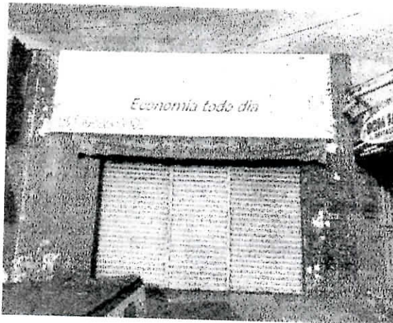
Fachada do imóvel.