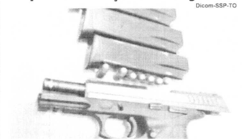
No momento da ação, outro indivíduo também acabou preso em flagrante