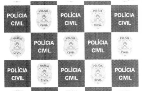
Operação teve como objetivo dar cumprimento a mandados de busca na cidade de Paraíso

No decorrer dos trabalhos investigativos, foi apurado que os indivíduos se utilizavam de métodos de dissuasão para convencer vítimas a encaminharem os "nudes", envolvendo até promessas em dinheiro que não eram cumpridas. Em outros casos, era realizada invasão do aparelho celular da vítima para obter as fotos.