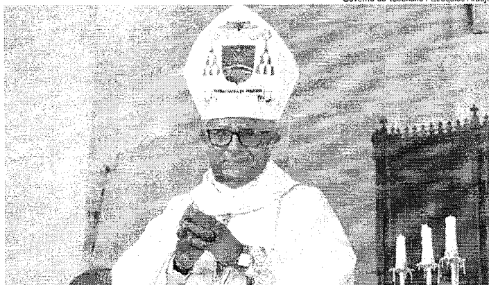
Dom José Moreira é o sexto bispo diocesano de Porto Nacional, criada em 1915

Já na condição de empossado, Dom José fez um breve relato do seu começo como religioso em Ponte Alta e Porto Nacional, onde frequentou o seminário e agora retorna na condição de bispo diocesano. Ressaltou que a sua casa estará aberta sempre para acolher os fiéis, como sempre recomendou o papa Francisco. "Estamos à disposição dos padres e dos fiéis 24 horas, como preconiza o papa Francisco", pontuou o bispo.