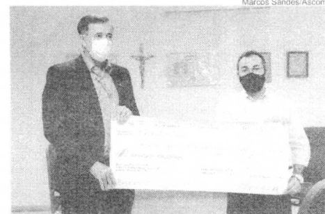
Todas as doações arrecadadas anualmente pelo FIA são destinadas às instituições que executam projetos sociais, como a APAE de Araguaína e a Casa de Davi

beram recurso para execução de projetos são: APAE (Associação de Pais, Amigos dos Excepcionais de Araguaína), Rotary Club de Araguaína - Lago Azul, ISCA (Instituto Social e Cultural Araguaína), Instituto Humanitário Casa de Davi, Amigos e Profissionais dos Autistas do Tocantins; ISCA (Instituto Social e Cultural Araguaína); e Instituto Humanitário Anita Luiza.