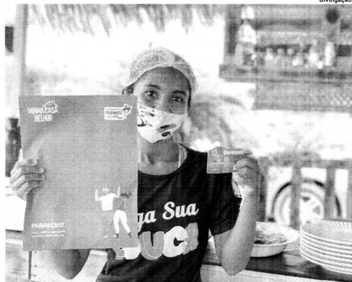
Mais de 45 mil pessoas foram beneficiadas na edição anterior do Minha Casa Melhor

Coordenado pela Secretaria de Estado de Governo (Segov), o programa tem como objetivo garantir auxílio financeiro a pessoas em situação