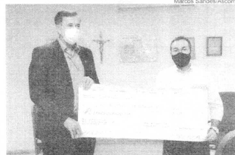
Todas as doações arrecadadas anualmente pelo FIA são destinadas às instituições que executam projetos sociais, como a APAE de Araguaína e a Casa de Davi

beram recurso para execução de projetos são: APAE (Associação de Pais, Amigos dos Excepcionais de Araguaína), Rotary Club de Araguaína - Lago Azul, ISCA (Instituto Social e Cultural Araguaína), Instituto Humanitário Casa de Davi, Amigos e Profissionais dos Autistas do Tocantins; ISCA (Instituto Social e Cultural Araguaína); e Instituto Humanitário Anita Luiza.