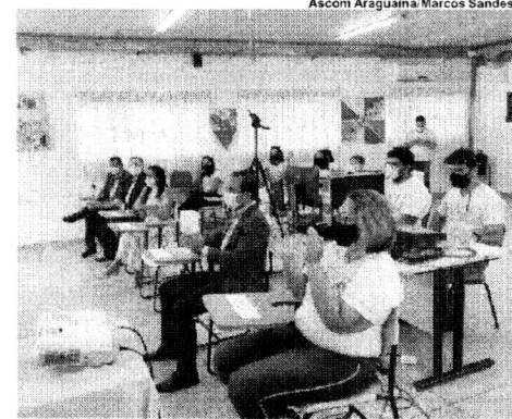
Por meio da parceria, o Município disponibiliza professores que atuam no projeto, e este ano também irá ceder o prédio que será utilizado para as aulas após o retorno das atividades presenciais

O Programa UMA (Universidade da Maturidade) é um projeto de extensão da UFT que integra os alunos da Universidade da Maturidade com os estudantes da graduação, promovendo atividades físicas, culturais e sociais a população da terceira idade. "A assinatura do termo de cooperação com a Prefeitura de Araguaína consolida uma história de nove anos da UMA na cidade e é de ex-