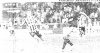
Fernando Santos/W9 Press

O confronto, contudo, segue marcado para o dia 20 de fevereiro